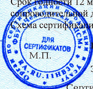
Схема сертификации 1с.

Срок годности 12 месяцев. Условия хранения указаны в прилагаемой к продукции товаро-сопроводительной документации, на упаковке, этикетке.