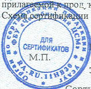
Схема сертификации 1с.

ДОПОЛНИТЕЛЬНАЯ ИНФОРМАЦИЯ Срок годности 10 месяцев. Условия хранения указаны в прилагаемой к продукции товаро-сопроводительной документации, на упаковке, этикетке.